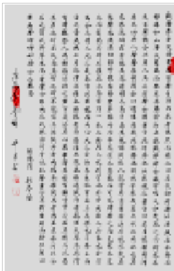
书法 (74×46cm) 朱中昌/书