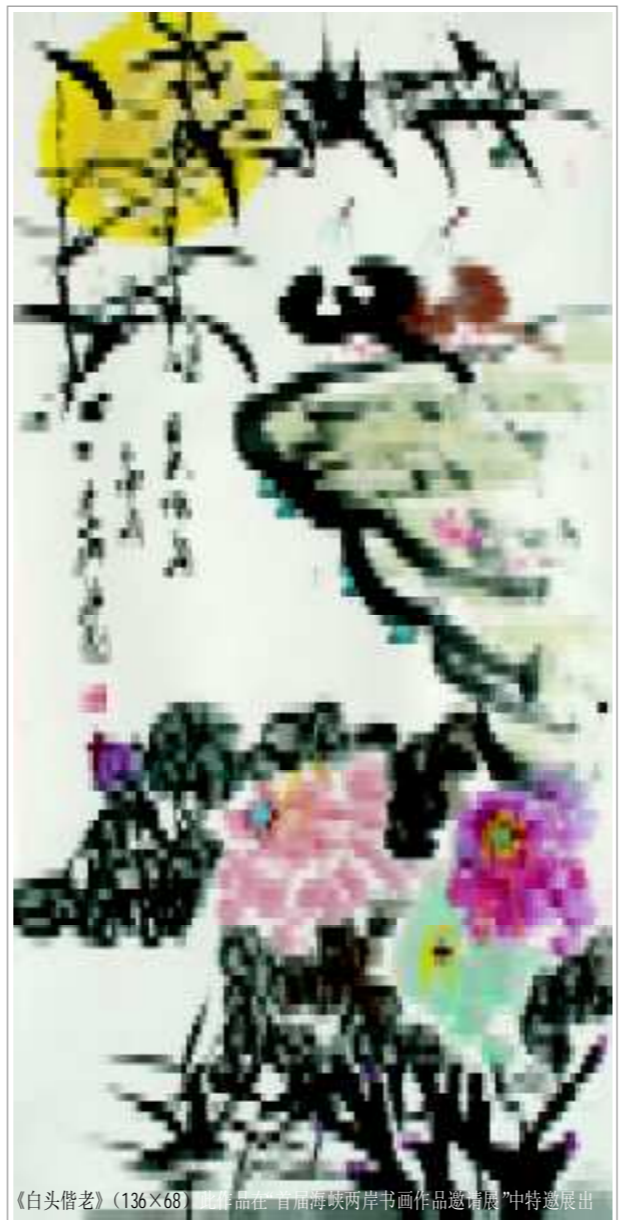
《白头偕老》(136×68) 王承典 中国书画函授大学烟台分校“中”特聘展出